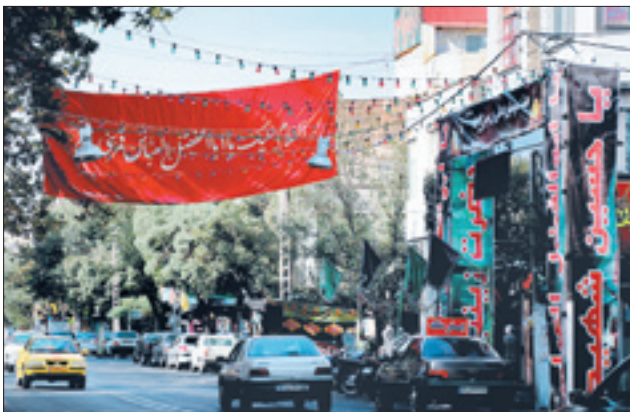
عطر محرم در خیابان‌های تهران | سعید سجادی | باشگاه خبرنگاران